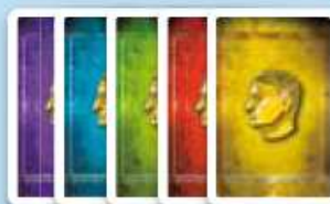
40 obchodníků (po 8 v 5 barvách)