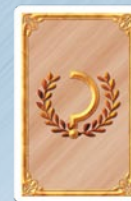
• 5 cílových karet "Okolí"