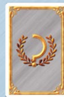
• 5 cílových karet "Městská rezidence"