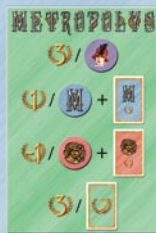
• 1 přehled