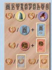
• 1 přehled