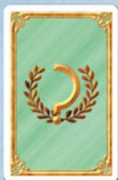
• 4 cílové karty "Okolí"