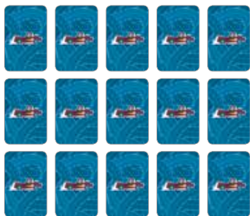
Obrázok 1: Počiatočné nastavenie

Karty sú umiestnené na stole smerom nadol v niekoľkých radoch ako pri bežnom pexese. Hráči sa striedajú. Cieľom hry je zhromaždiť, čo najviac kariet. Najmladší hráč začína hru.