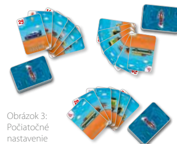
Obrázok 3: Počiatočné nastavenie

Odstráňte všetky karty bez čísel (napr. Sanitky). Zvyšné karty sa rozdelia medzi všetkých hráčov rovnakým počtom a otočia smerom nadol. Každý hráč si vezme svoje karty a položí si ich pred seba na kopy. Aby ste zaistili rovnaký počet kariet pre každého hráča, môžete vyradiť posledných pár kariet. Hra začne tým, že si každý hráč vezme zo svojej kopy 6 kariet.